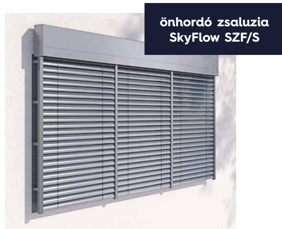
önhordó zsaluzia SkyFlow SZF/S

Az önhordó zsaluziákat elsősorban nagy üvegfelülettel rendelkező homlokzatú épületekre történő beépítésre tervezték. Az átgondolt szerkezetnek köszönhetően a teherviselő elemek a lefutók, amelyek a terhet homlokzati oszlopokra viszik át. A termék moduláris beépítést tesz lehetővé egy tokba, akár 6000 mm szélességig. Max. méretek: 4500 × 4000 mm (max. fel. 18 m 2 ).