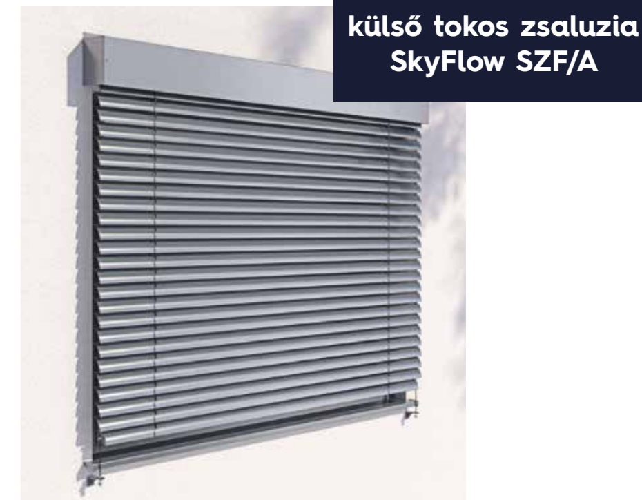
külső tokos zsaluzia SkyFlow SZF/A

A vakolható BX zsaluzia elsősorban az új épületekre történő gyors és könnyű beépítés gondolatával jött létre. A védőtok hajlított alumíniumlemezből készült, előregyártott elem. Mindkét oldalon alkalmazható vakolattartóval, ami bármilyen vakolási munka kivitelezését lehetővé teszi. A rendszerhez dedikált lefutók tartoznak, kétféle méretben, amelyek megkönnyítik a gyors felszerelést. A zsaluzia maximális méretei 4500 × 4000 mm (max. felület 18 m 2 ).