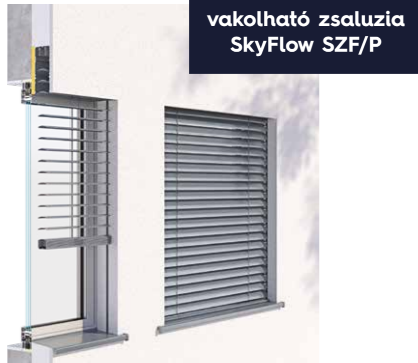
vakolható zsaluzia SkyFlow SZF/P

Az önhordó zsaluziákat elsősorban nagy üvegfelülettel rendelkező homlokzatú épületekre történő beépítésre tervezték. Az átgondolt szerkezetnek köszönhetően a teherviselő elemek a lefutók, amelyek a terhet homlokzati oszlopokra viszik át. A termék moduláris beépítést tesz lehetővé egy tokba, akár 6000 mm szélességig. Max. méretek: 4500 × 4000 mm (max. fel. 18 m 2 ).