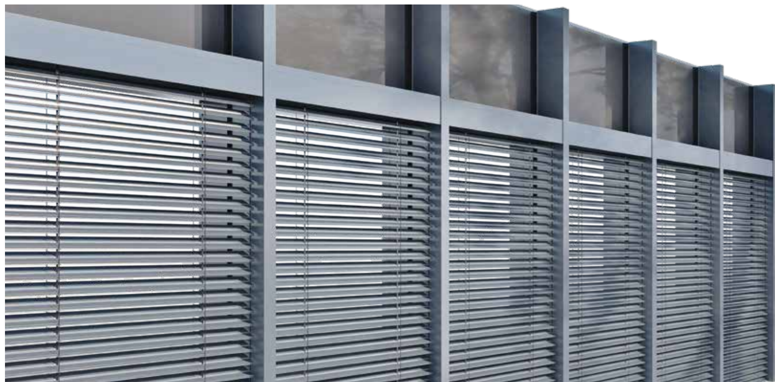
homlokzati zsaluzia MB-SR50N ZS

Az MB-SR50N ZS rendszer egy innovatív megoldás, amely egyesíti a SkyFlow homlokzati zsaluziarendszert az Aluprof MB-SR50N oszlop-bordás homlokzati rendszerrel. Elsősorban létesítmények/épületek megvalósítására gondolva jött létre, ahol a technikai és esztétikai szempontok közötti teljes összhang kiemelt szerepet játszik. Ezeket a szempontokat szem előtt tartva az oszlopokhoz speciális beszorító léceket terveztek, amelyek lehetővé teszik a homlokzati kitöltést, valamint olyan takaróprofilokat, amelyek egyben a homlokzati zsaluzia lefutójának szerepét is betöltik. Ennek köszönhetően az ilyen típusú árnyékolók beépítéséről a beruházás későbbi szakaszában is meg lehet hozni a döntést, amikor a homlokzat már be van építve az épületbe. A teljes napellenző mechanizmust szintén diszkréten elrejtették egy esztétikus, extrudált alumíniumból készült tok mögé. A termék alumínium és zsinóros lefutóval is kapható. Max. méretek: 4500 × 4000 mm (max. fel. 18 m 2 ).