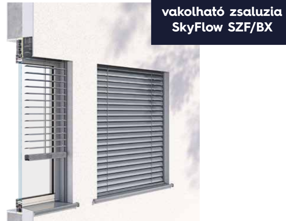
vakolható zsaluzia SkyFlow SZF/BX

A vakolható változatú zsaluzia újonnan emelt épületekbe történő beépítésre szolgál, vagy meglévő épületekben, az áthidalók megfelelő átépítése után. Az árnyékoló tokja extrudált alumíniumból készül, megfelelő vakolattartóval, amely lehetővé teszi a vakolást bármilyen befejező anyaggal. Max. méretek: 4500 × 4000 mm (max. fel. 18 m 2 ).